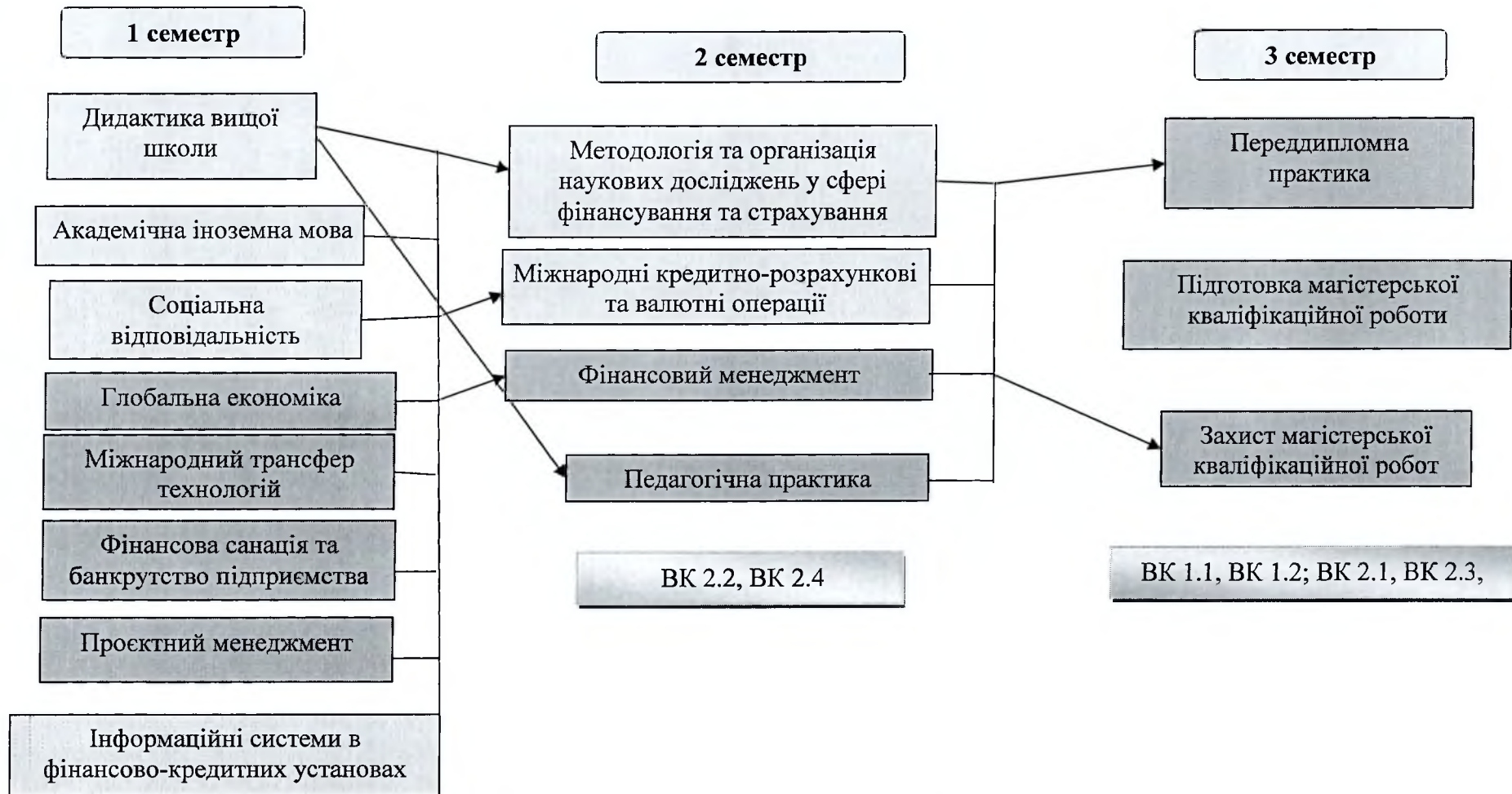
Рис. 1. Взаємозв'язок складових програми підготовки магістра у сфері фінансової, банківської та страхової діяльності